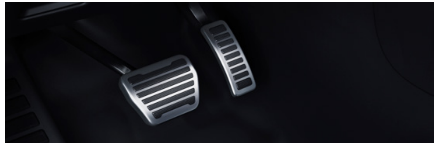
ブライトメタルペダル