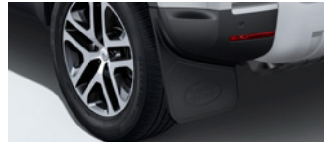
フロント&リアクラシックマッドフラップ