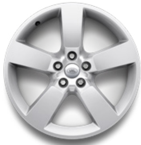
20" スタイル5098 ポリッシュドシルバー

現代的でダイナミックなデザインのアロイホイールのバリエーションで、あなたのクルマにさらなる個性を。