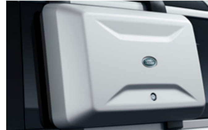
エクステリアサイドマウントギアキャリア