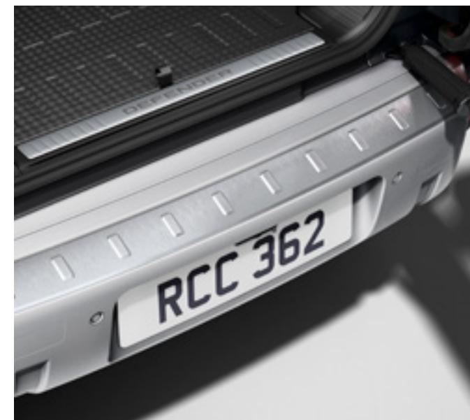
ブライトリアスカッププレート