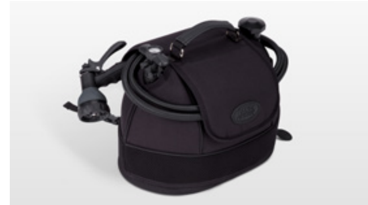
ポータブルシャワーシステム