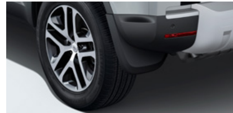
フロント&リアマッドフラップ