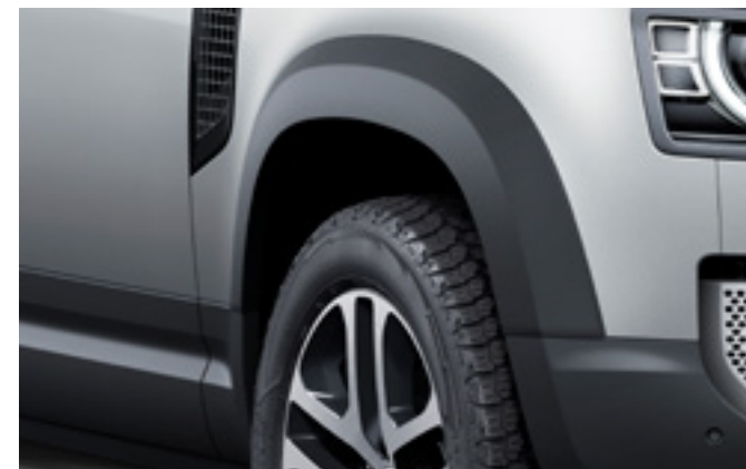
ホイールアーチプロテクション