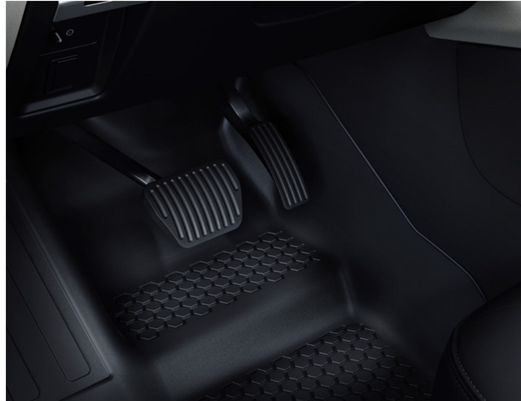
ディープサイドラバーフロアマット