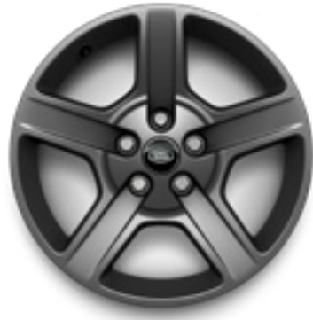
18" スタイル5094 サテndaークグレイ

現代的でダイナミックなデザインのアロイホイールのバリエーションで、あなたのクルマにさらなる個性を。