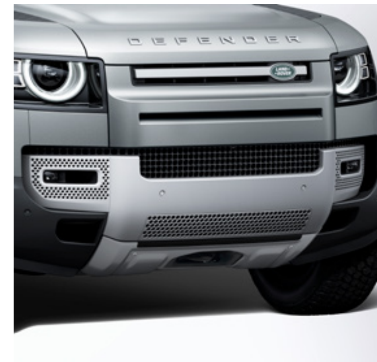
フロントアンダーシールド