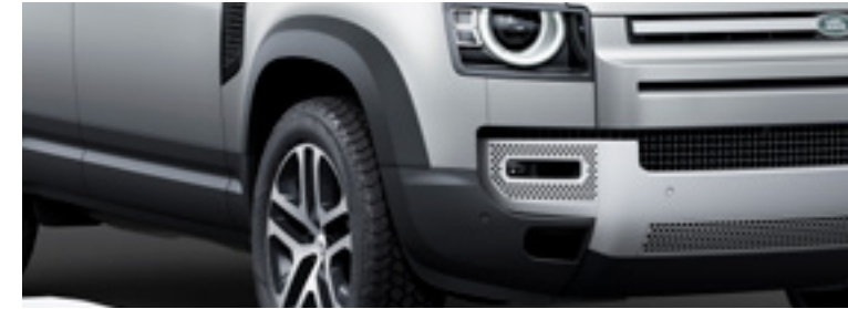
ホイールアーチプロテクション