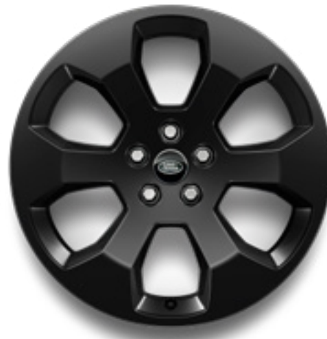
20" スタイル6011 グロスブラック