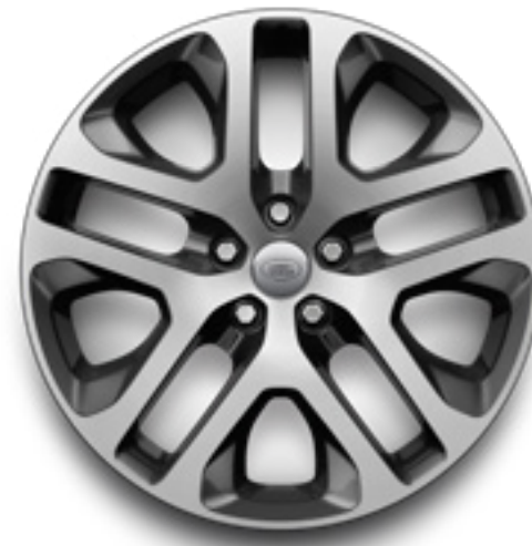
20" スタイル5095 ダイヤモンドターndダークグレイコントラスト