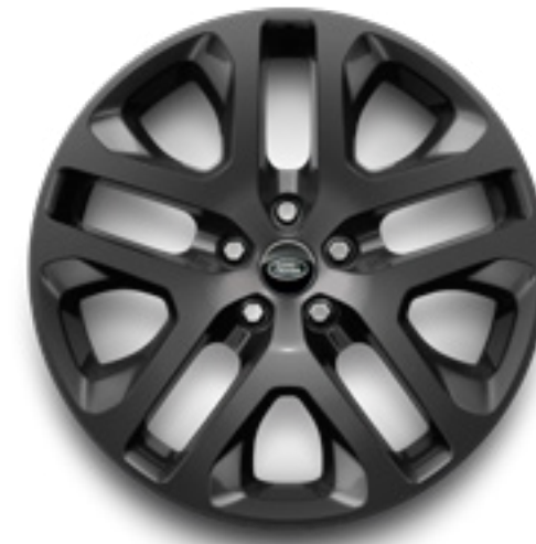
20" スタイル5095 ダークグレイ