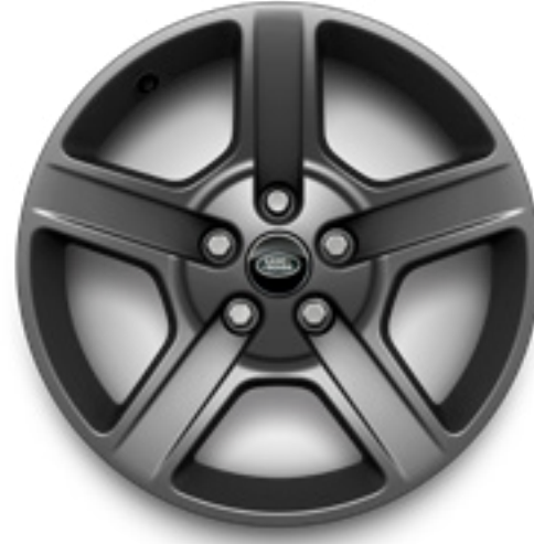
20" スタイル5094 サテndaークグレイ