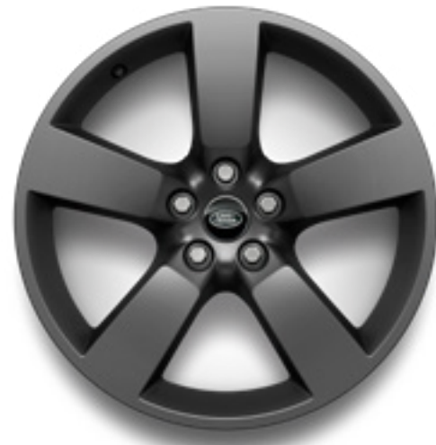
20" スタイル5098 サテンダークグレイ