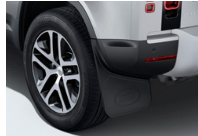
フロント&リアクラシックマッドフラップ