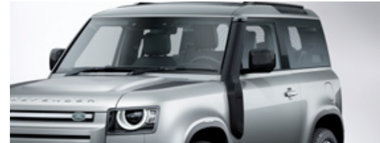
レイズドエアインテーク