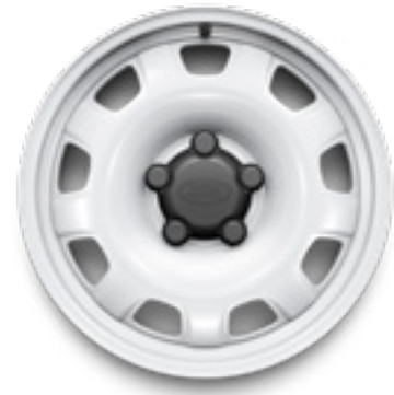
18" スタイル5093, スチール, フジホワイト