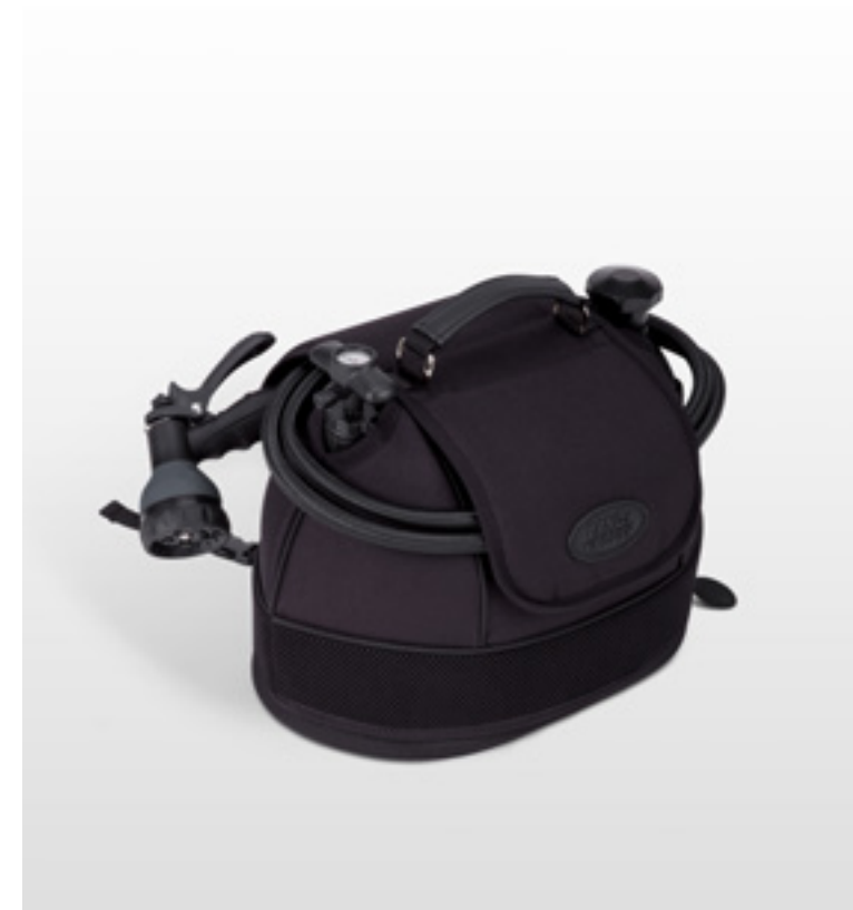
ポータブルシャワーシステム