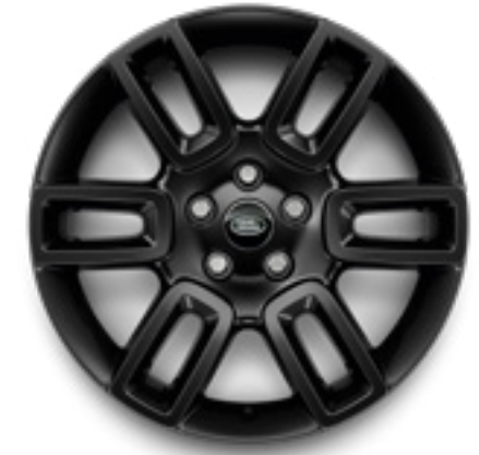
19" スタイル6010 グロスブラック