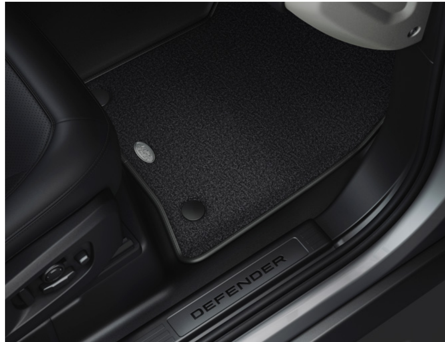
ラグジュアリーカーペットマット