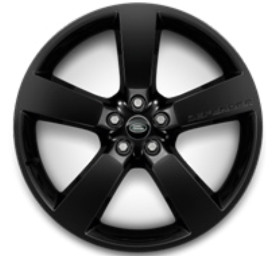
22" スタイル5098 グロスブラック