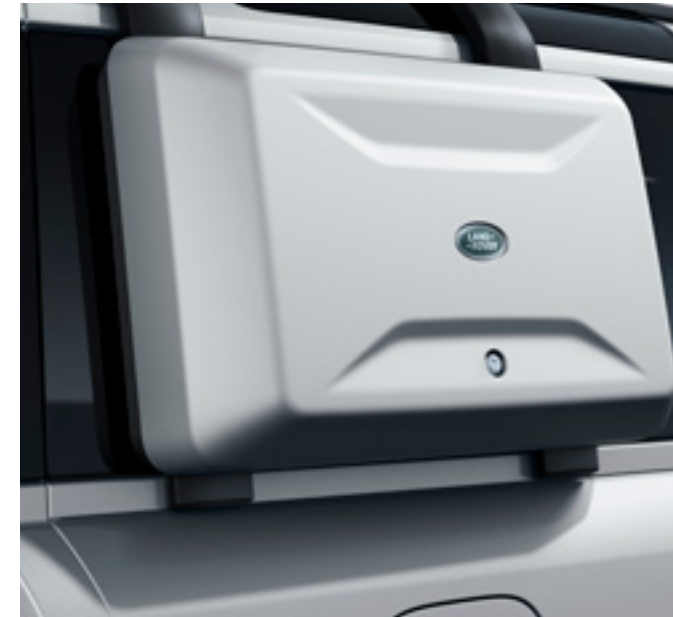
エクステリアサイドマウントギアキャリア