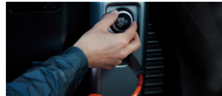
インテグレートッドエアコンプレッサー