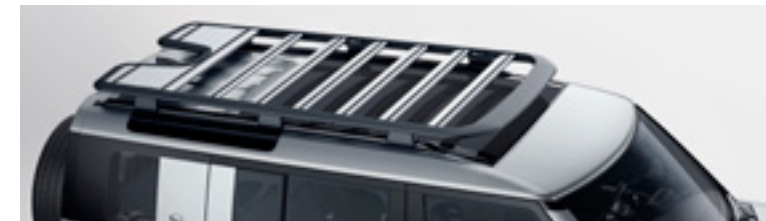
エクスペディションルーフラック