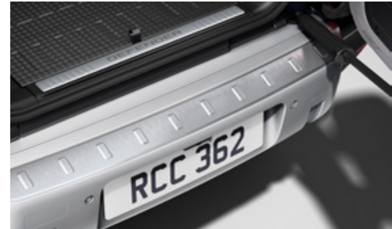
ブライトリアスカッププレート