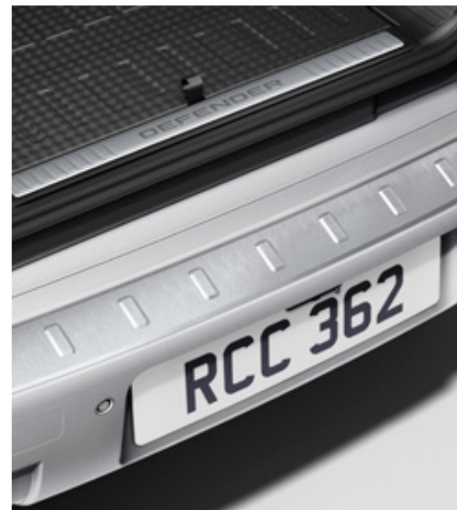
ブライトリアスカッププレート