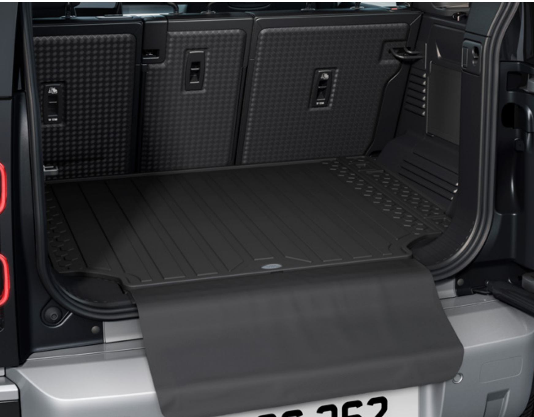
ロードスペースラバーマット