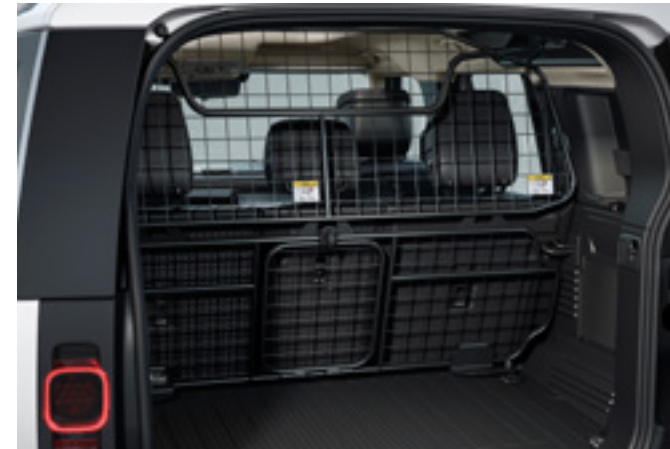
フルハイトロードスペースパーティション