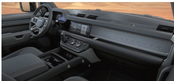
エボニーグレイレザーシートフェイスिंग (エボニーインテリア) ※日本仕様は右ハンドル。