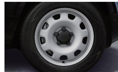
20インチ“スタイル9013” (グロスホワイトフィニッシュ)