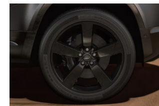
22インチ"スタイル5098" (グロスブラックフィニッシュ)

主要諸元 ●全長4,945mm×全幅1,995mm×全高1,970mm ●車両重量: 2,450kg ●乗車定員: 5名 ●右ハンドル ●8速AT ●AWD ●オールシーズンタイヤ ●4,999cc V8 スーパーチャージドガソリンエンジン、最高出力525PS、最大トルク625N・m