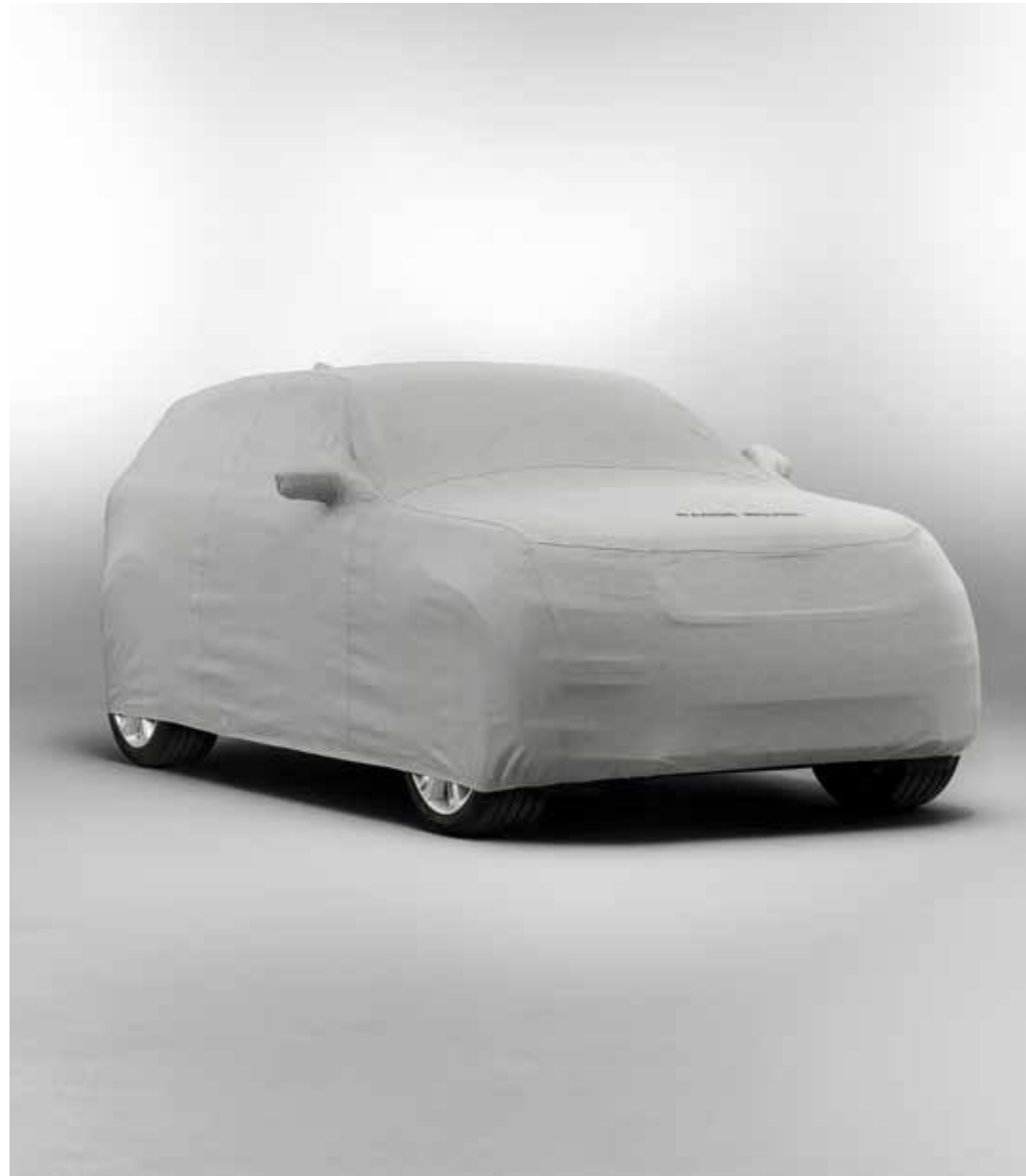
オールウェザーカーカバー

引き出して使う便利なプロテクター。リアバンパーを傷や摩耗から保護し、衣服の汚れも防いでくれます。丈夫なファブリック製で、ロードスペースの床下に折りたたんで収納されます。