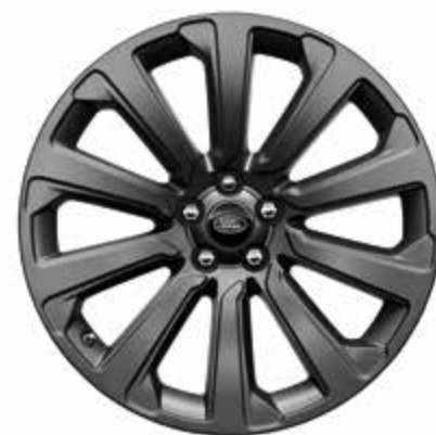
20インチ スタイル 1032 サテンダークグレーフィニッシュ