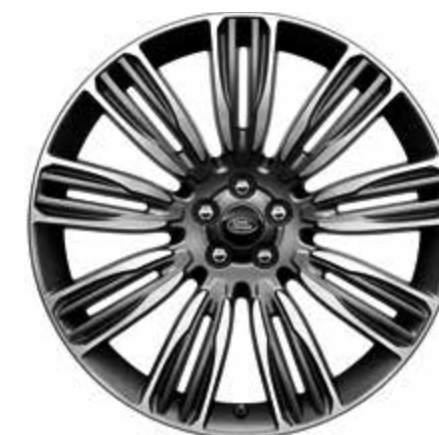
22インチ スタイル 9007 ダイヤモンドターンドフィニッシュ