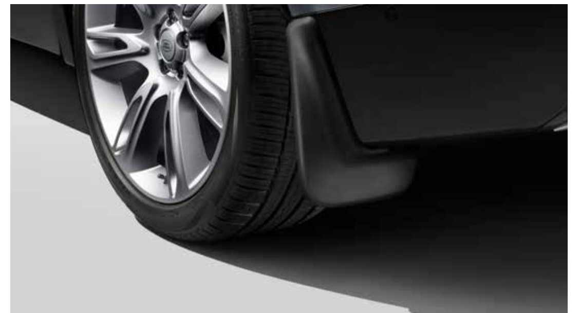
マッドフラップ — フロント/リア

RANGE ROVER VELAR のデザインを損なうことなく、走行中の泥はねや小石から塗装を保護します。に装着できます。