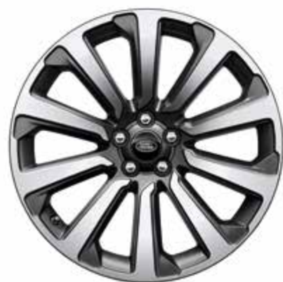
20インチ スタイル 1032 ダイヤモンドターンドフィニッシュ