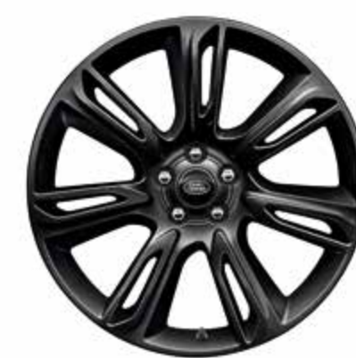
20インチ スタイル 7014 グロスブラックフィニッシュ