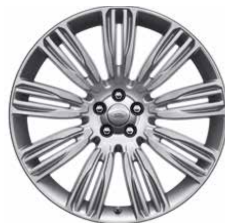
22インチ スタイル 9007