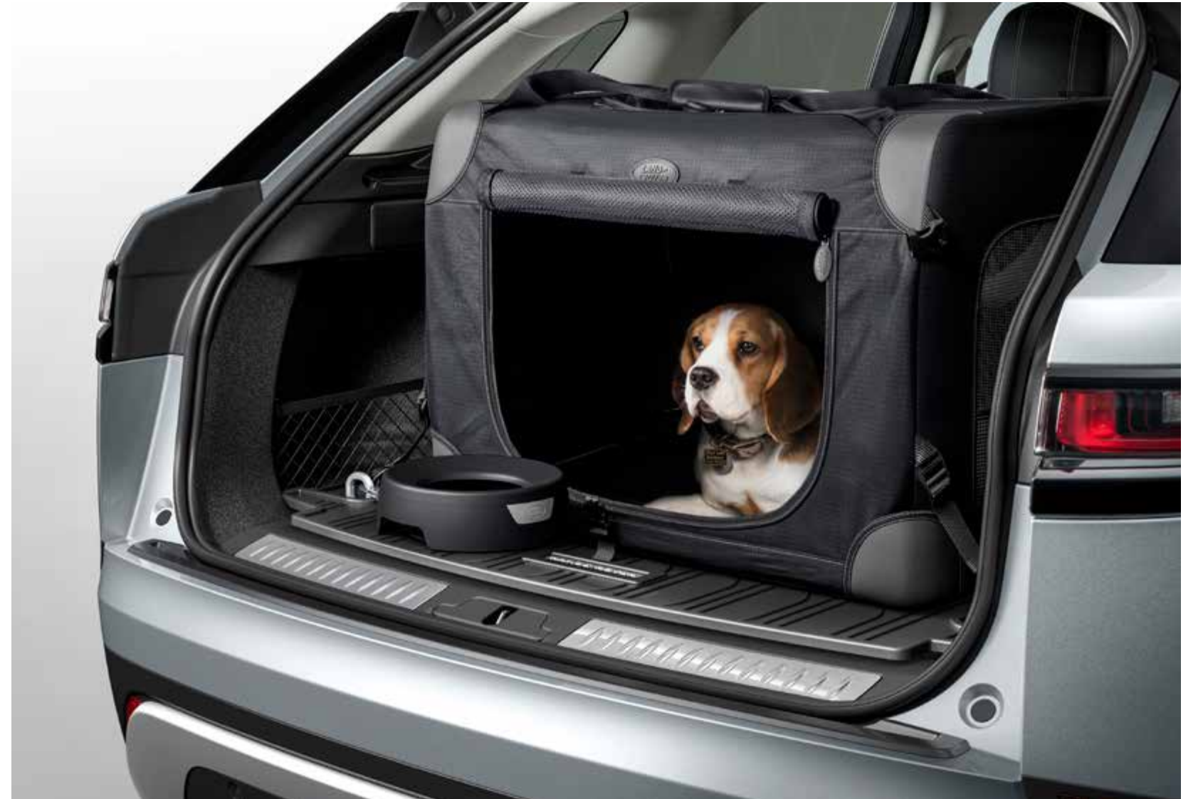
ペットトランスポートレーションパック

濡れた足や泥だらけの足から荷物スペースを保護し、簡単に掃除できるように設計されています。 キルティングロードスペースライナー、フルハイトラゲッジパーティション、ウォーターボウルを組み合わせています。