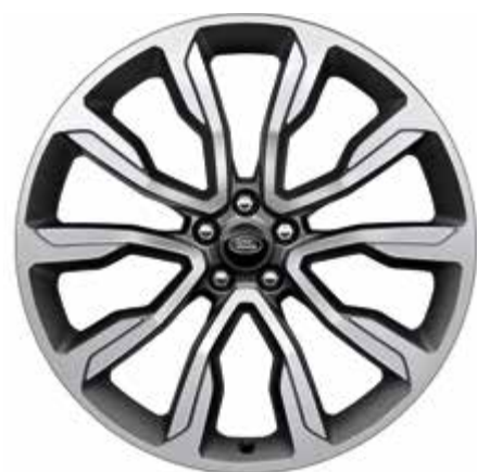
22インチ スタイル 1051 ダイヤモンドターンドサテンテクニカル グレーフィニッシュ