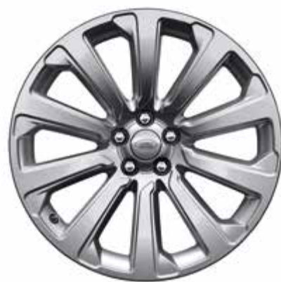
20インチ スタイル 1032