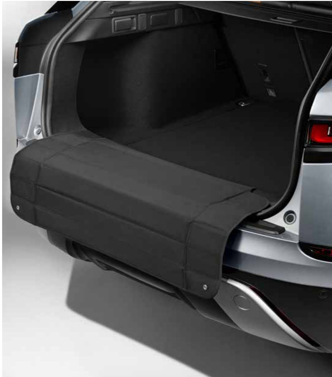
バンパープロテクター

引き出して使う便利なプロテクター。リアバンパーを傷や摩耗から保護し、衣服の汚れも防いでくれます。丈夫なファブリック製で、ロードスペースの床下に折りたたんで収納されます。