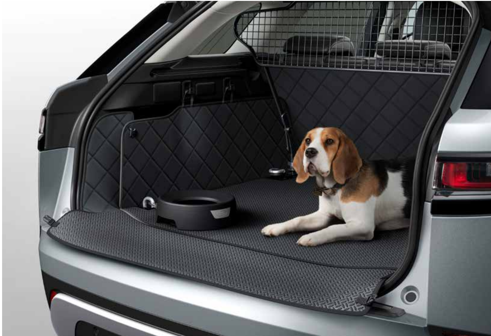
ペットロードスペースプロテクションパック

濡れた足や泥だらけの足から荷物スペースを保護し、簡単に掃除できるように設計されています。 キルティングロードスペースライナー、フルハイトラゲッジパーティション、ウォーターボウルを組み合わせています。