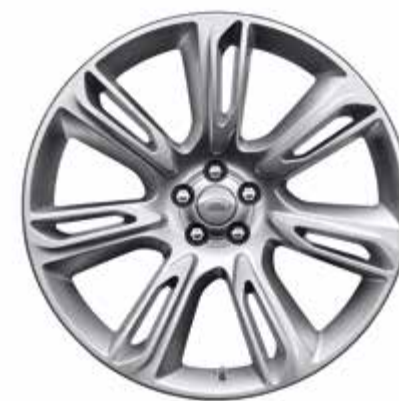
20インチ スタイル 7014