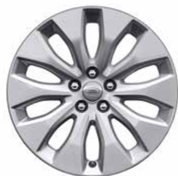
18インチ スタイル 1021

現代的でダイナミックなデザインのアロイホイールのバリエーションで、あなたのクルマにさらなる個性を。