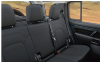
マニュアル3列目シート