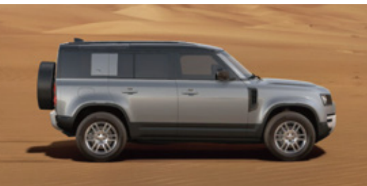
エクステリアカラー：アイガーグレイ (メタリック) ルーフカラー：ブラック (コントラストルーフ)