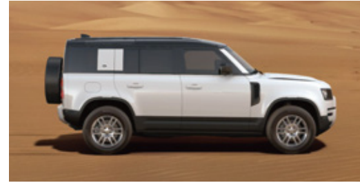
エクステリアカラー：フジホワイト (ソリッド) ルーフカラー：ブラック (コントラストルーフ)