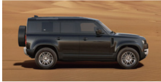
エクステリアカラー：サントリーニブラック (メタリック) ルーフカラー：ボディ同色