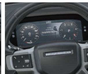
インタラクティブドライバー ディスプレイ