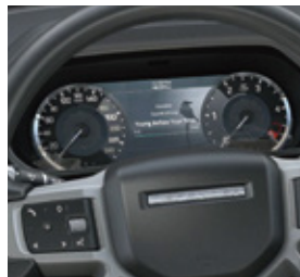
アナログダイヤル (セントラルTFTディスプレイ付)