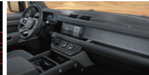
エボニーグレイレザーシート (エボニー/エボニーインテリア)