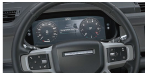
インタラクティブドライバーディスプレイ