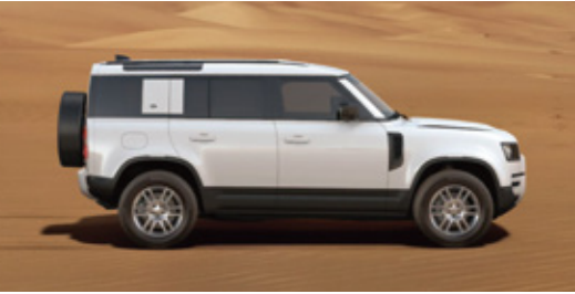
エクステリアカラー：フジホワイト (ソリッド) ルーフカラー：ボディ同色