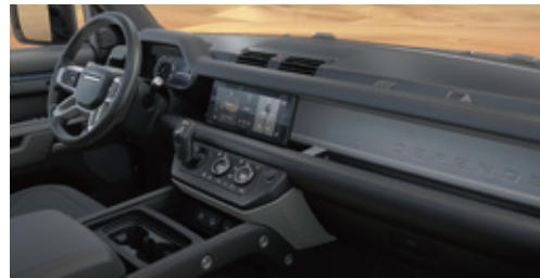
エボニーファブリックシート (エボニーインテリア)