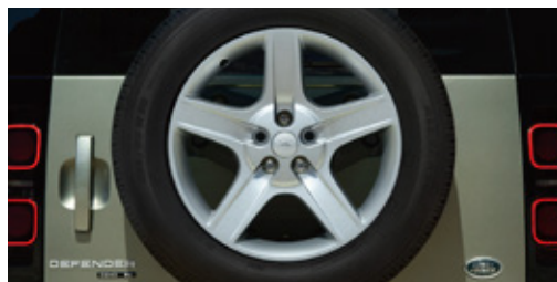
20インチ"スタイル5094"5スポーク (グロススパークルシルバーフィニッシュ)