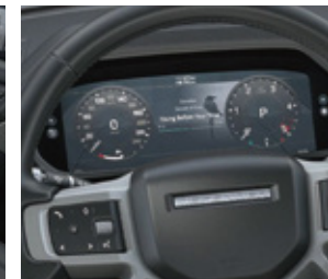
インタラクティブドライバーディスプレイ