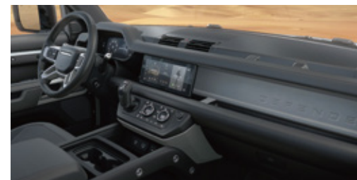
エボニーグリーンレザーシート& ロバステックアクセント (エボニーインテリア)