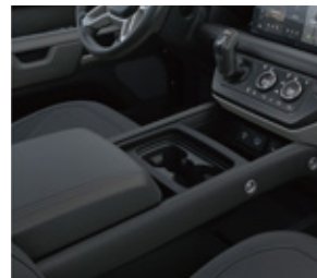
センターコンソール (アームレスト付)