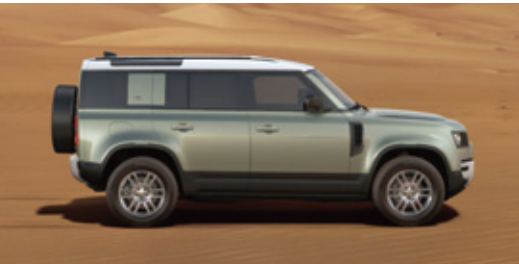
エクステリアカラー：パンゲアグリーン (メタリック) ルーフカラー：ホワイト (コントラストルーフ) X-Dynamic SE Curated Editionでは選択いただけません。