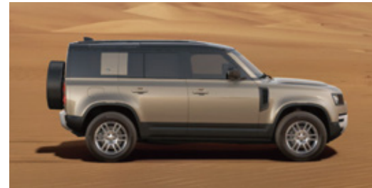
エクステリアカラー：ゴンドワナストーン (メタリック) ルーフカラー：ブラック (コントラストルーフ)