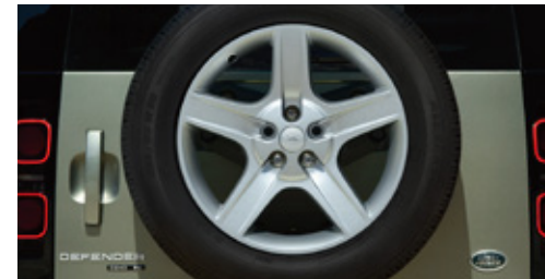
20インチ"スタイル5094"5スポーク (グロスパークルシルバーフィニッシュ)