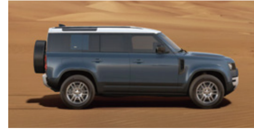
エクステリアカラー：タスマンブルー (メタリック) ルーフカラー：ホワイト (コントラストルーフ) X-Dynamic SE Curated Editionでは選択いただけません。