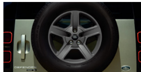
18インチ"スタイル5094"5スポーク (サテンダークグレイフィニッシュ)