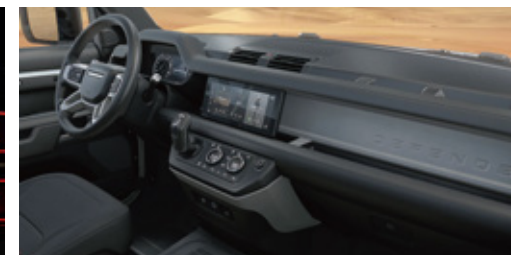
エボニーファブリックシート (エボニーインテリア)