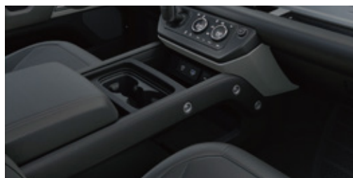
センターコンソール (アームレスト付)