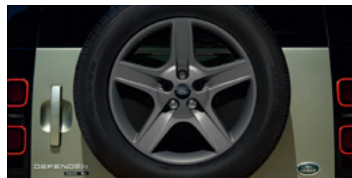
20インチ"スタイル5094"5スポーク (サテンダークグレイフィニッシュ)