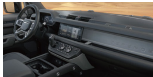
エボニーグリーンレザーシート (エボニー/エボニーインテリア)