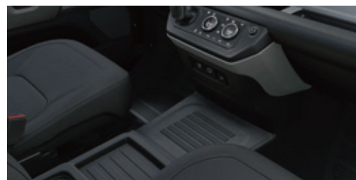
キャビンウォークスルー