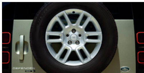
19インチ"スタイル6010"6スポーク (グロスブラックシルバートリニッシュ)