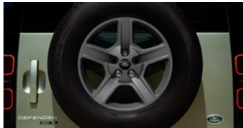
18インチ"スタイル5094"5スポーク (サテndaークグレイフィニッシュ)