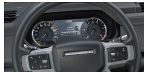
アナログダイヤル (セントラルTFTディスプレイ付)