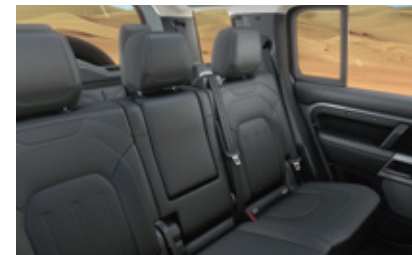
マニュアル3列目シート