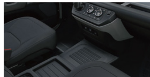
キャビンウォークスルー