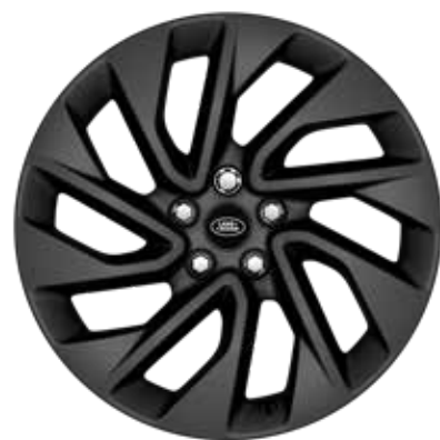
20" スタイル5122、5スプリットスポーク、 サテンダークグレイ