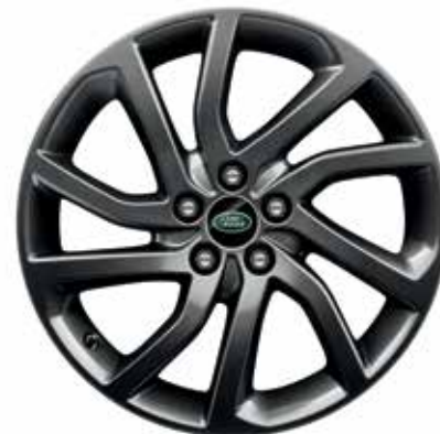
20" スタイル5011、5スプリットスポーク、 サテンダークグレイ